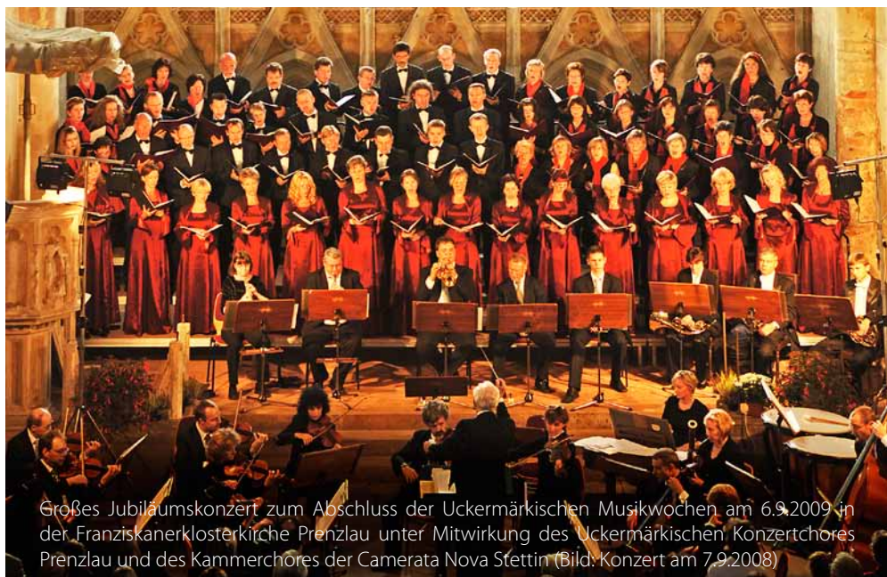
Großes Jubiläumskonzert zum Abschluss der Uckermärkischen Musikwochen am 6.9.2009 in der Franziskanerklosterkirche Prenzlau unter Mitwirkung des Uckermärkischen Konzertchores Prenzlau und des Kammerchöres der Camerata Nova Stettin (Bild: Konzert am 7.9.2008)