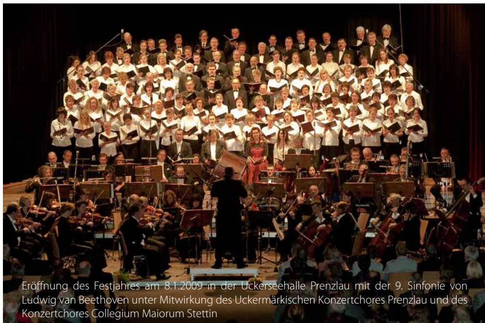
Eröffnung des Festjahres am 8.1.2009 in der Uckerseehalle Prenzlau mit der 9. Sinfonie von Ludwig van Beethoven unter Mitwirkung des Uckermärkischen Konzertchores Prenzlau und des Konzertchores Collegium Maiorum Stettin