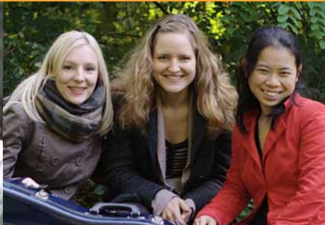
Ensemble „Ucca Nova“