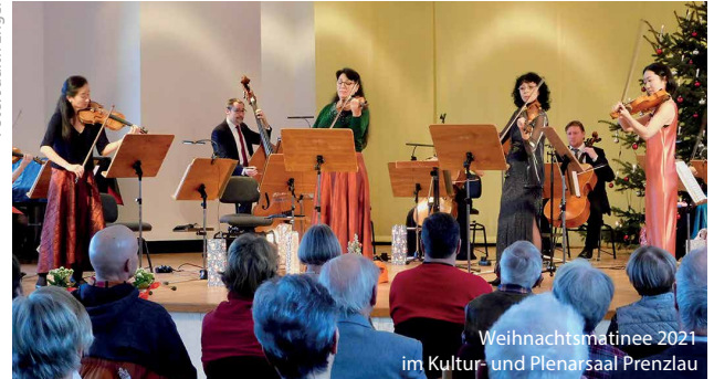
Weihnachtsmatinee 2021 im Kultur- und Plenarsaal Prenzlau

Sonnabend, 31. Dezember 2022 16.00 Uhr Theater Luckenwalde