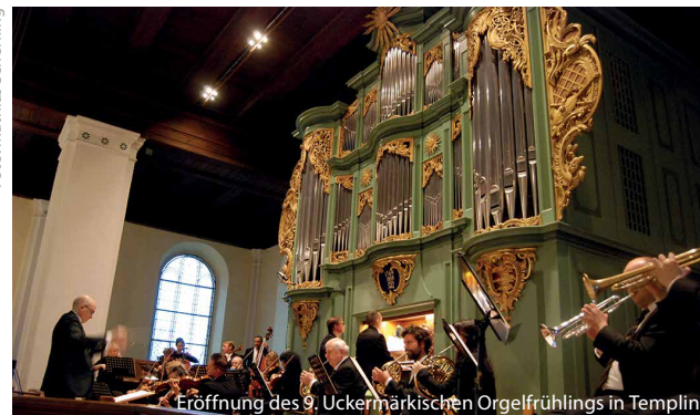
Eröffnung des 9. Uckermärkischen Orgelfrühlings in Templin