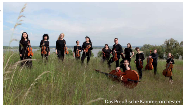
Das Preußische Kammerorchester