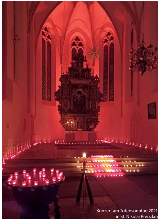
Konzert am Totensonntag 2021 in St. Nikolai Prenzlau