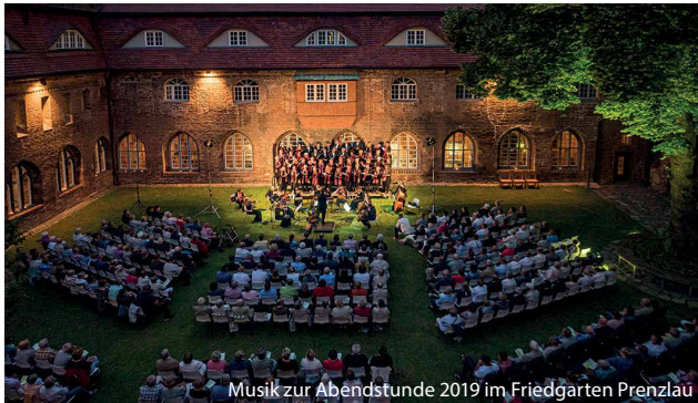
Musik zur Abendstunde 2019 im Friedgarten Prenzlau