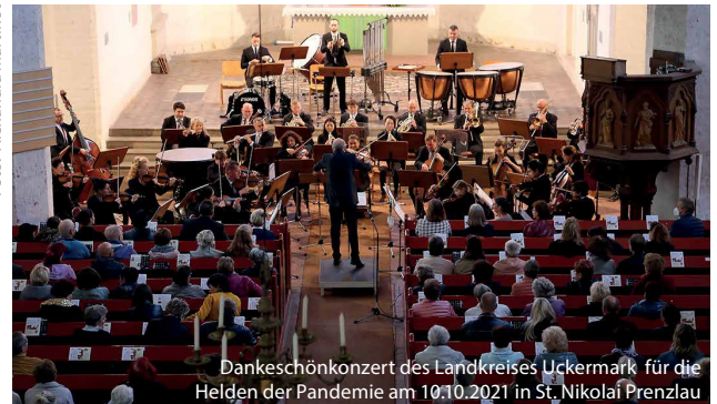
Dankeschönkonzert des Landkreises Uckermark für die Helden der Pandemie am 10.10.2021 in St. Nikolai Prenzlau