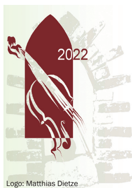
Logo: Matthias Dietze