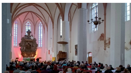
Nikolaikirche •