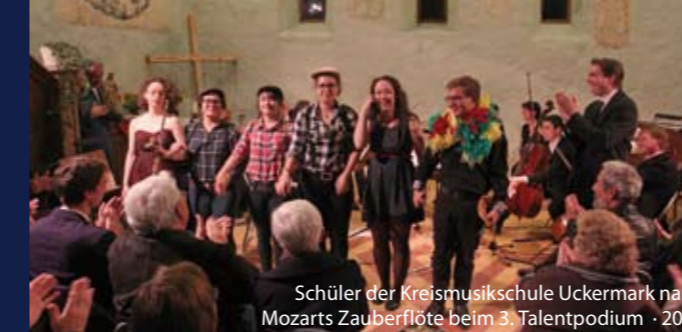
Schüler der Kreis Musikschule Uckermark nach Mozarts Zauberflöte beim 3. Talentpodium · 2015

Veranstalter: Kultur- und Festspielhaus Wittenberge