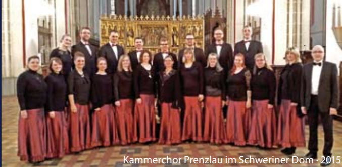
Kammerchor Prenzlau im Schweriner Dom · 2015

Veranstalter: Internationales Orgelfestival Stettin